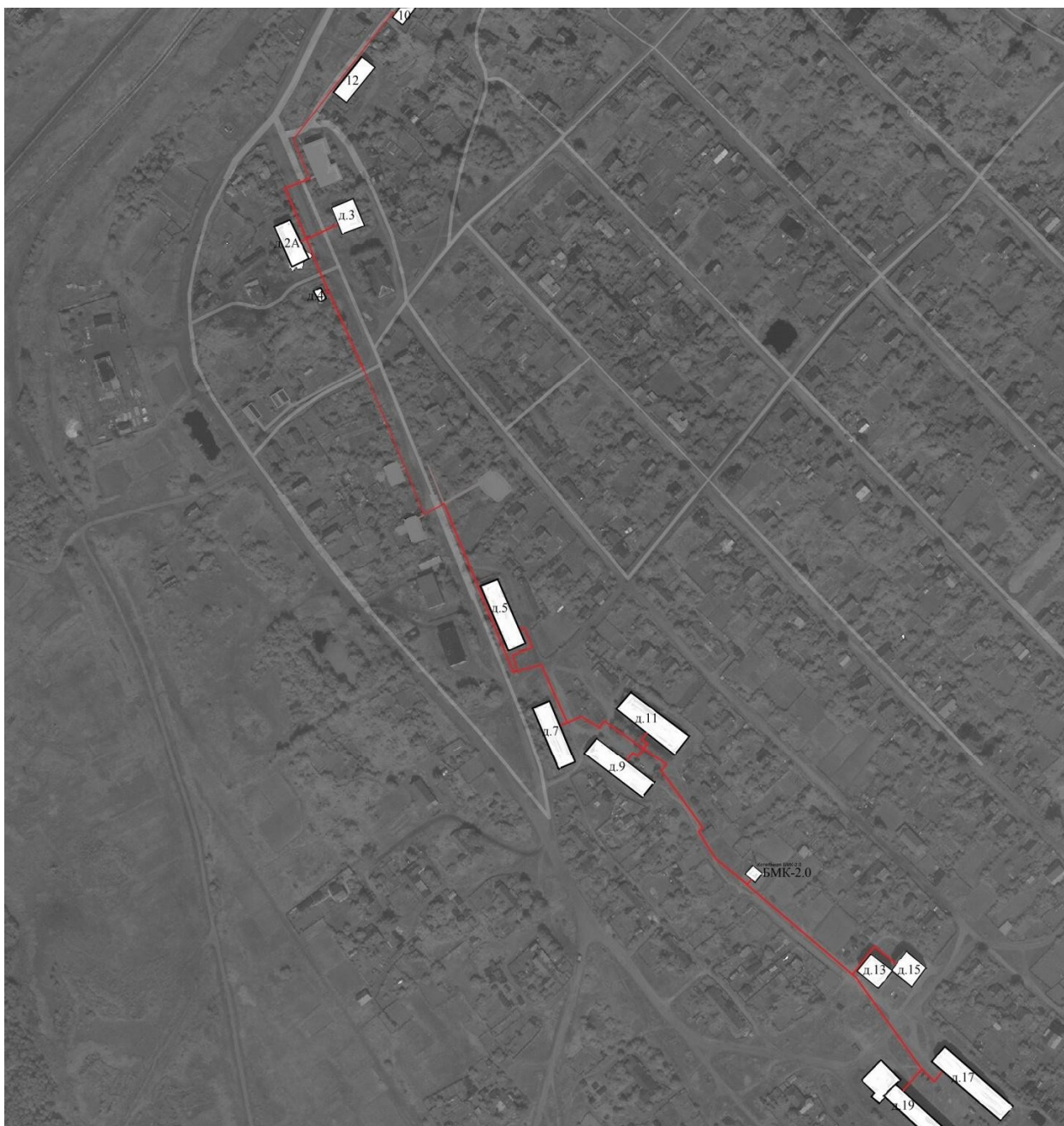
Схема теплосети котельной № БМК-2.0 пос. Космынино